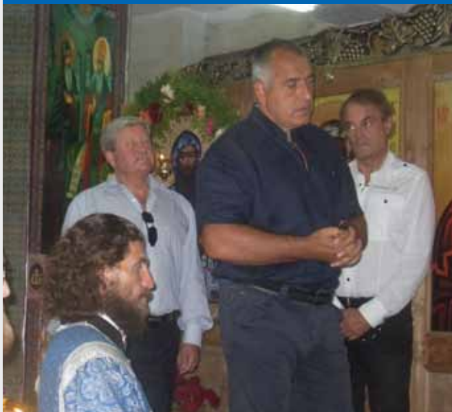
Премиерът Бойко Борисов посети новостроящия се храм „Свети Прокопий Варненски“, където